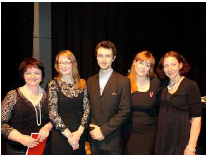
🏠 2013.gada 18.novembra svinību orgkomiteja.