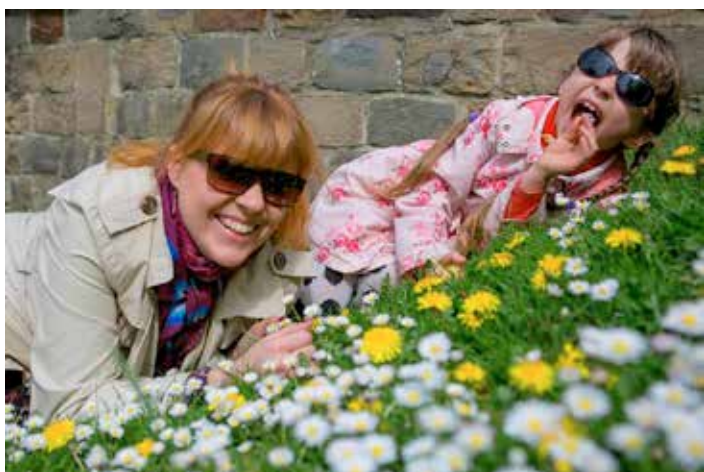
🏠 Ar meitu Noru.

arī izveidoti atsevišķi apakškonti korim un skolīpai (šis gan ir punkts, kas beļģu banku sistēmas specifikas dēļ bija pamatīgi ievilcies), gan palīdzējuši atrast jaunas telpas un to finansējumu, kad prezidentūras dēļ visiem kolektīviem no pārstāvniecības telpām nācās aiziet.