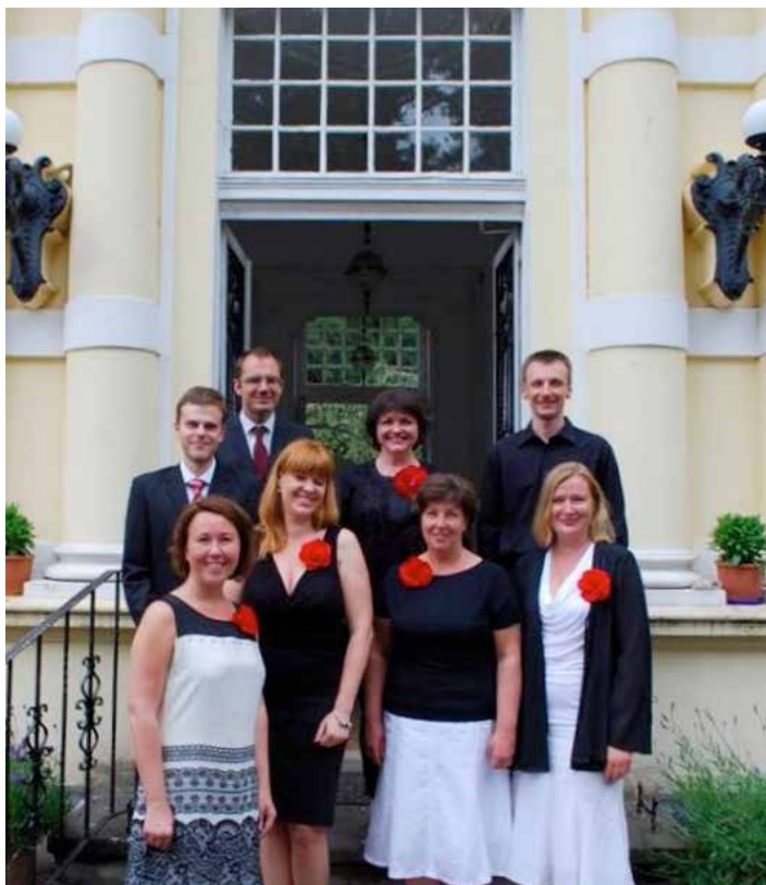
🏠 Vokālā grupa UGUNIS.